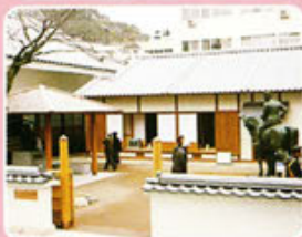
③秋山好古・真之生誕地